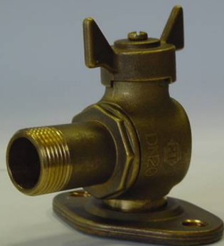
RT20 1024 VARTB15M