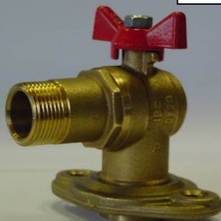
IBERBOL 20 C81329