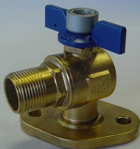
SIL 20 BAT 18AST