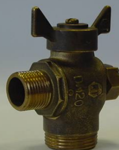
RT20 1024 VARTS15304M