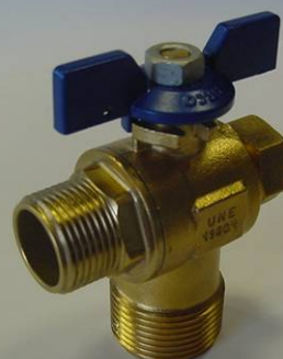
SIL 20 BAT 22AST