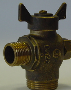
RT20 1024 VARTS15304M