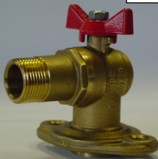
IBERBOL 20 C81329