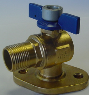
SIL 20 BAT 18AST