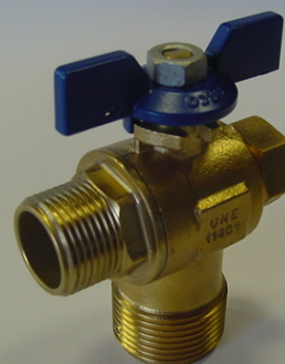
SIL 20 BAT 22AST